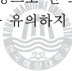
<표 4-7> 북항 이용자 대상 로지스틱 회귀분석 결과

<표 4-7>은 북항 이용자를 대상으로 터미널 특성 변수 3개만 설명변수로 채택한 모형 결과이다. 결과는 전체 응답자를 대상으로 한 모형의 결과와 유사하다. 생산성 차이는 유의하나 요금차이와 TGS 차이는 유의하지 못하다. 생산성 차이는 북항 선택에 양(+)의 영향을 미친다.