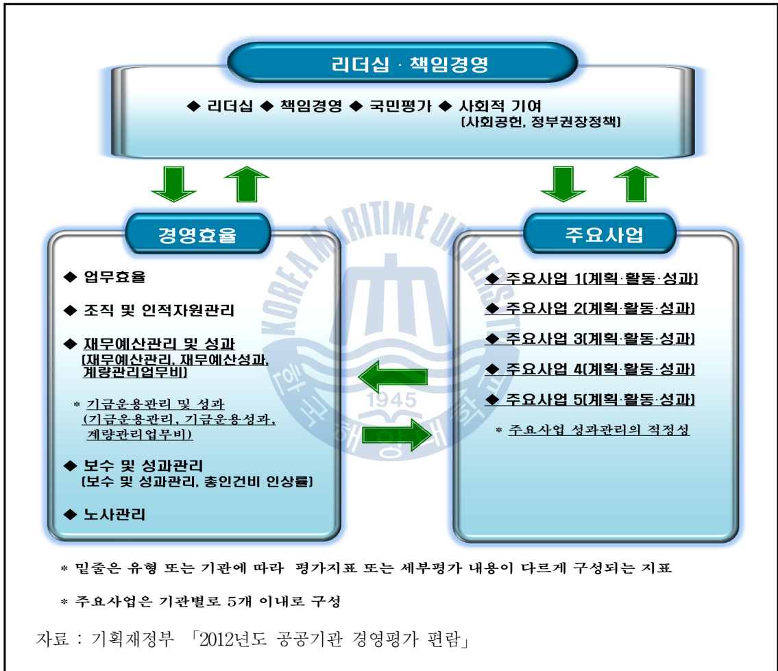
<그림 3-2> 공기업 경영평가 구성 체계(2011·2012년도)

평가부문 및 평가지표의 구성 체계는 다음의 <그림 3-2>와 같다. 6)