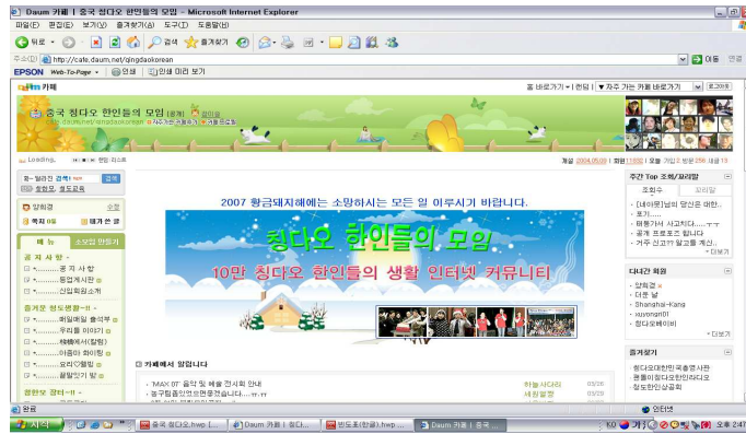
그림 4 ‘중국 칭다오 한인들의 모임’메인화면

약 한달 간의 준비모임을 거친 뒤 2004년 6월 1일에 문을 열게 되었다. 한국인들 사이의 정보공유 및 칭다오 거주 한국인들의 교류와 협력을 목적으로 개설한 이 인터넷 커뮤니티는 개설자 홀로 인터넷 커뮤니티를 개설한 것이 아니라 뜻을 같이 하는 몇 명의 사람들과 준비모임을 가지고 함께 개설을 하였기 때문에 빠른 속도로 성장할 수 있었다. 문을 연지 3개월만인 2004년 9월에 회원수가 1000여 명에 달했고, 같은 해 12월에는 회원수가 3000여 명에 달했다.