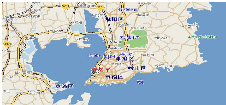
그림 2 칭다오시 지도

칭다오는 7개의 구와 5개의 현(縣)급시를 관할하고 있다. 칭다오의 7개 구 중에서도 한국인이 가장 많이 거주하는 곳은 시남구(市南區)이다. 이곳에는 교육문제 때문에 거주하는 한국인이 많다. 시남구의 명인광장(泛海名人廣場) 부근에는 한국인을 상대로 하는 학원들이 밀집하여 있다. 그리고 홍콩화원(香港花園)에는 유학생을 포함하여 홀로 칭다오에서 거주하는 분들이 많이 거주하고 있다. 이 아파트촌 내에는 한국식료품점, 한국음식점들이 많이 있다. 노산구(嶗山區)는 시남구에 비해 한국인들이 비교적 퍼져서 거주하고 있다. 그리고 한국의 공장과 기업체들이 많이 있는 성양구(城陽