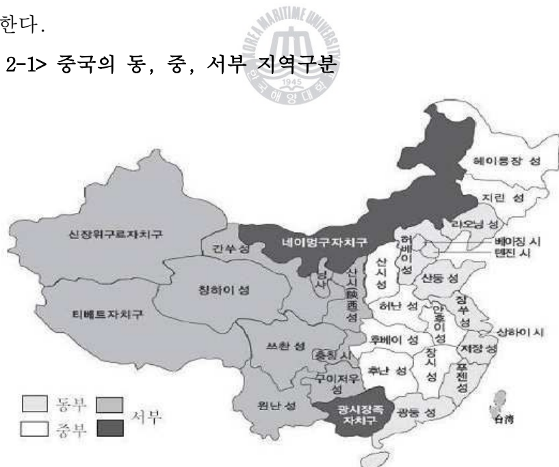
<그림 2-1> 중국의 동, 중, 서부 지역구분

주 1). 내몽고, 광시장족 자치구는 2000년에 각각 중부와 동부에서 서부로 변경.