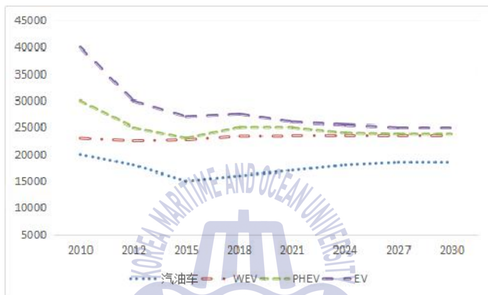
Fig. 2 미래 20년간 중국 자동차의 비용변화추이

전기자동차, 플러그인 하이브리드 자동차의 비용은 여전히 높은 편이다. 또한 전기자동차의 투자 회수 기간은 긴 편이다.